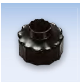
Усадочный колпачок МК