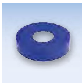
Колпачок от пыли MS